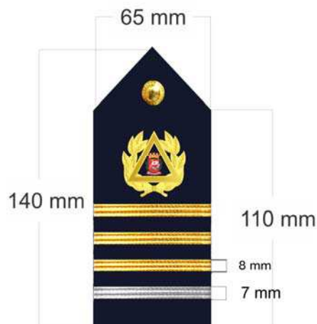
Platina sobreposta Amovível